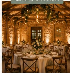
SALLE DE RÉCEPTION

Guirlandes guinguettes et bougies pour une ambiance conviviale et chaleureuse.