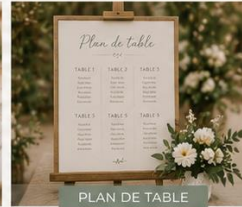
PLAN DE TABLE

Apporte une touche délicate et personnalisée