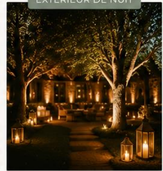
EXTÉRIEUR DE NUIT

Jeux de lumières dynamiques et scénographie pour faire vibrer la soirée.